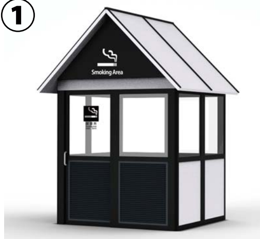
4～5人用 W: 2150 D: 2000 の例