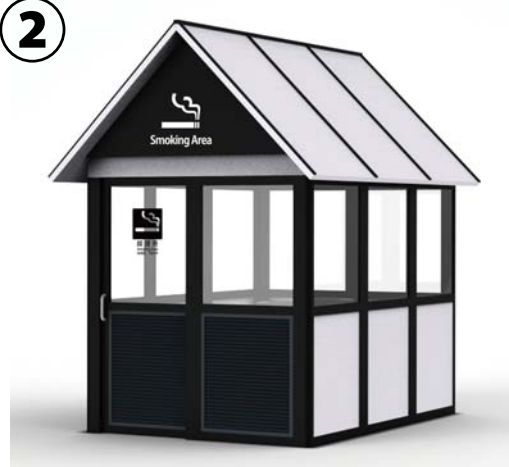
10～12人用 W: 2150 D: 3000 の例