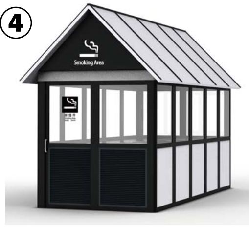
18～20人用 W: 2150 D: 5000 の例