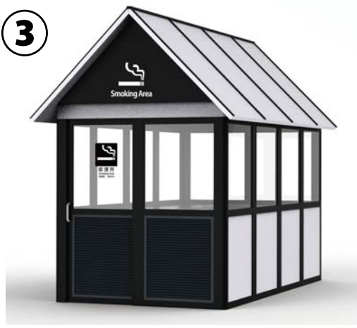
15～16人用 W: 2150 D: 4000 の例